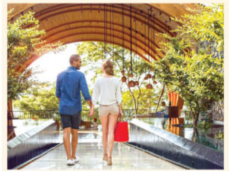
Hotel ANdAZ, foto ilustrativa.

El vuelo saldrá de la terminal doméstica de SANSA ubicada en el Aeropuerto Internacional Juan Santamaría. En algunos de los itinerarios, hace una escala en el aeropuerto Internacional Daniel Oduber de Liberia y continúa hasta Costa Esmeralda. Esto provee una oportunidad adicional para el viajero que desee combinar ambos destinos de playa en sus vacaciones. Costa Esmeralda se constituirá así en el primer destino internacional que opera SANSA.