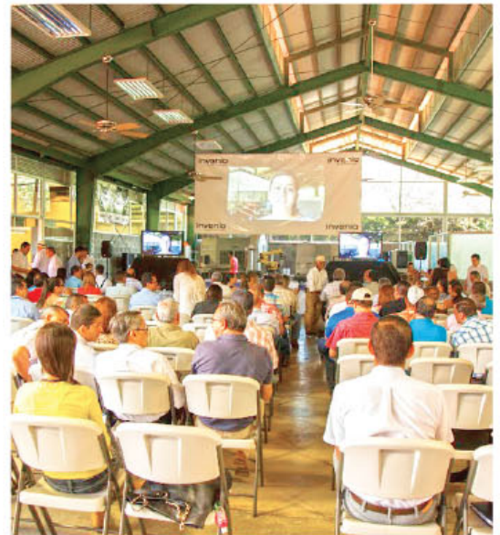
Público presente en la mesa de trabajo.

sociedad civil para generar proyectos de investigación en adaptación al cambio climático, innovación educativa e innovación productiva en áreas como uso de tecnologías de información en la agroindustria, en el marco de la creación del Mercado Regional Chorotega.