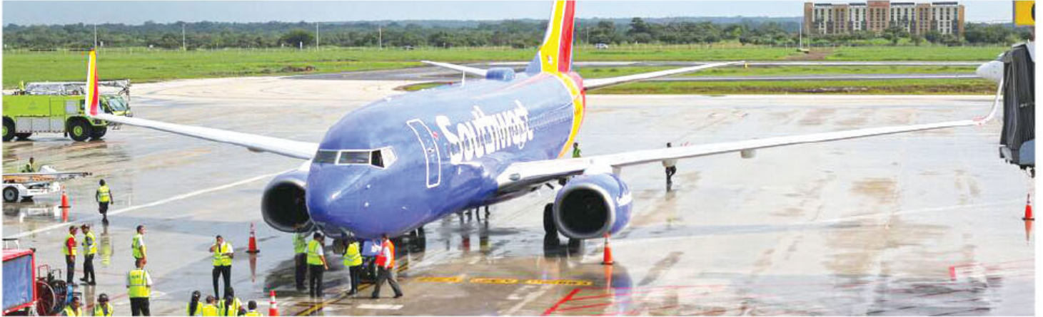
Llegada del primer vuelo Southwest en el Aeropuerto Daniel Oduber.