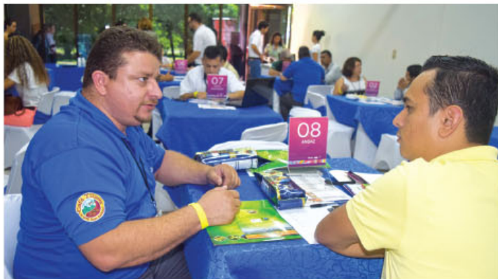
Empresarios y PYMES de la provincia de Guanacaste en el I Encuentro Empresarial Chorotega 2015.

Por su parte, algunas de las 45 empresas suplidoras que se encuentran ofreciendo sus productos son: Aquasistemas, Artesanías Heidy, Asociación Fruticultores de Lepanto, Caprisol, Carnicería Obando, Coopeldos, Cosméticos Monteverde, Crizarte, Datamax, El Baul Country, Evocare Café, entre otros.