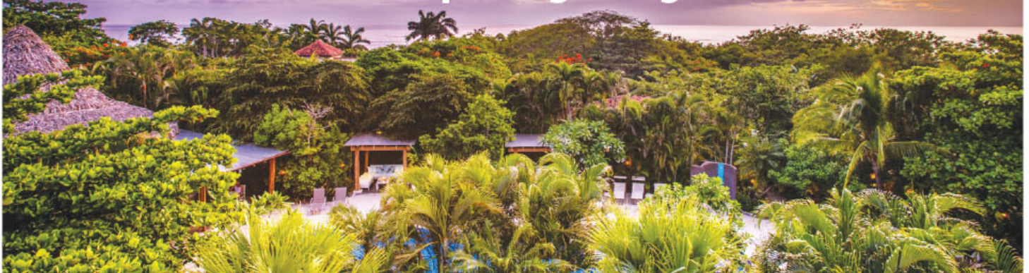
Vista panorámica del Hotel Cala Luna