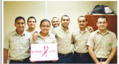
Equipo unido de Coopeguanacaste apoyando la campaña contra el cáncer de mama.

► Al año 376 mujeres y 111 en hombres son detectados con cáncer de seno según CCSS