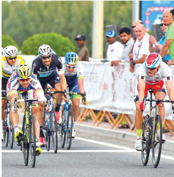
En total participarán 11 equipos costarricenses.

“A pesar de que tenemos mucho tiempo de no recorrer varias zonas guanacastecas, si tenemos claro que en los últimos dos años, tanto Liberia como Nicoya