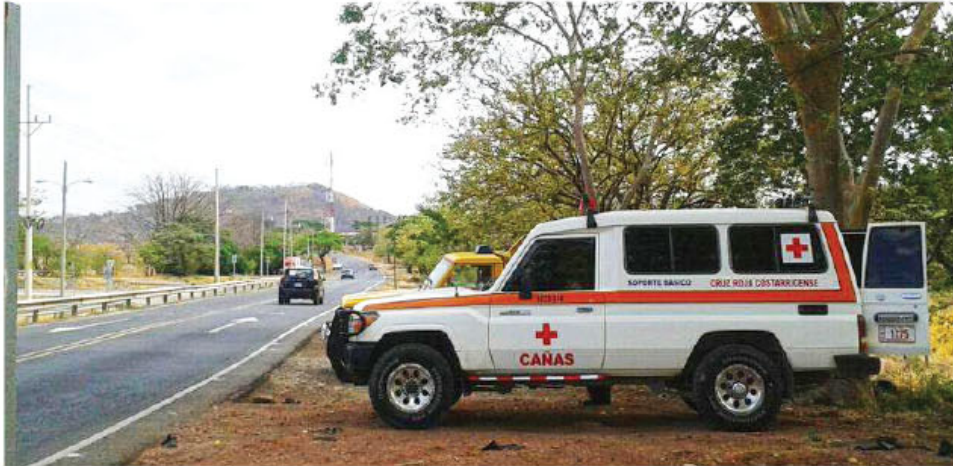
Cruz Roja durante vigilancia en la pasada Semana Santa.

Juan Pablo Estrada Gómez jestrada@asamblea.go.cr