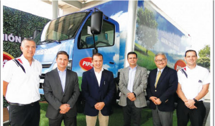
Altas autoridades de Cargill Costa Rica y Grupo Purdy Motor en el acto inaugural del nuevo camión híbrido.