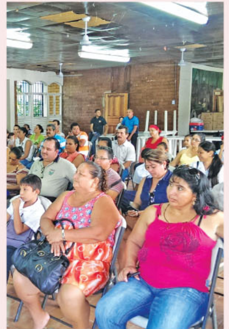
Público presente en el acto oficial donde hizo entrega de las donaciones por la Sociedad Seguros de Vida.

► Material didáctico, electrónico y deportivo fueron parte de las entregas