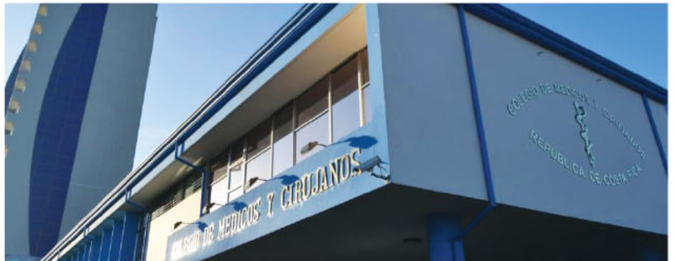
Fachada del edificio del Colegio de Médicos y Cirujanos de Costa Rica.