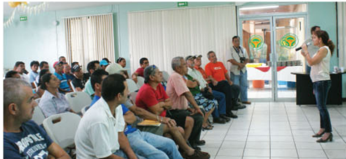
Público presente en el foro denominado "El futuro de la pesca de arrastre en el Pacífico costarricense", realizado el pasado 31 de julio en Santa Cruz. La actividad tuvo el acompañamiento de Mar Viva.

Actualmente, el futuro de la pesca de arrastre en Costa Rica se discute en un proceso convocado por el gobierno, denominado "Mesa de Diálogo para el Aprovechamiento Sostenible del Camarón, Generación de Empleo y Combate a la Pobreza", el cual tiene como uno de sus objetivos principales elaborar un proyecto de ley que regule la pesca de arrastre en el país, a pesar, de que en 2013 la Sala Constitucional prohibió otorgar y renovar licencias hasta que no se solucionaran tres aspectos importantes con base a criterios