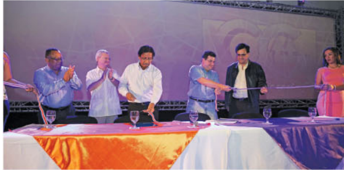
En la mesa principal el Ministro de la Presidencia, Sergio Alfaro Salas, corta la cinta en el acto oficial del lanzamiento de la red de telecomunicaciones de COOPEGUANACASTE.

El contar con fibra hasta el hogar (Fiber to the home) es una ventaja comparativa que coloca este nuevo servicio de Coopeguanacaste, R.L. como líder en la región y a la vanguardia en el uso de soluciones de alta demanda para el sector residencial como para el comercial e industrial.