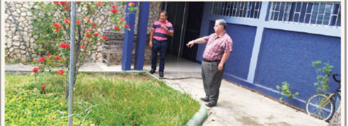
Durante la primera fase del Proyecto se realizará un diagnóstico que permita determinar la ubicación óptima del sistema de almacenamiento en las edificaciones cubiertas por el plan. (fotografía con fines ilustrativos)