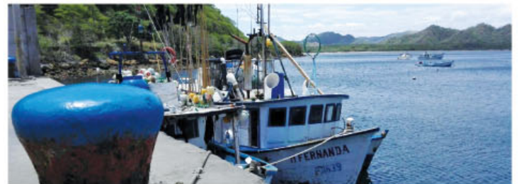
Este equipo tiene la capacidad de producir 10 tm de hielo /días.