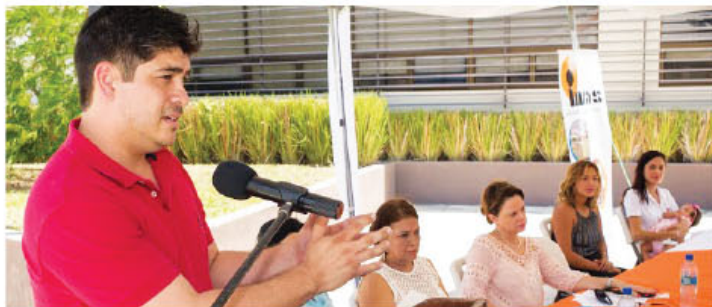
33 instituciones asumieron el reto de iniciar el proceso de reorganización de la estructura social de Costa Rica.

Las personas encargadas de efectuar el enlace entre las necesidades de las familias en pobreza extrema y la oferta institucional, son los cogestoras sociales,