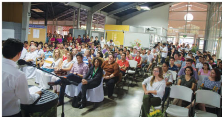
Público presente en la actividad.

En el marco de las actividades del 25 de julio, el Gobierno de la República consolidó el proyecto para la construcción del mejor Ecosistema Empresarial de la provincia, del cual será parte el Centro Internacional para Servicios de Alta Tecnología de Guanacaste.