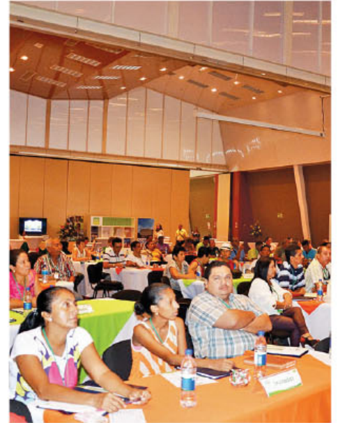
El evento se realizó el pasado 31 de julio.

Para el año en curso el MTSS dispone de 5.217 millones de colones dirigidos en su totalidad a las personas beneficiarias. Las Asociaciones de Desarrollo guanacastecas interesadas en recibir apoyo del programa PRONAE 4X4 deben hacer una solicitud formal en las oficinas del Ministerio de Trabajo.