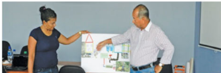
Durante el taller del 16 y 17 de abril 2015 se desarrolló una maqueta por los participantes en donde se evidenció la situación actual y la situación futura con las biojardineras y el proceso de educación ambiental que esto conlleva.

Las biojardineras o humedales artificiales son unidades que dan tratamiento a las aguas residuales y permite la reutilización del agua, que aunque no sea completamente pura, puede ser utilizada