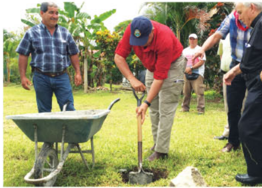
Presidente de la República participó en la colocación de la primera piedra.

El apoyo decidido a las operaciones comerciales de pequeños empresarios, asociaciones y grupos de productores es el objetivo del mercado de artesanos de Hojancha, el cual tendrá un impacto positivo en las actividades de 300 familias.