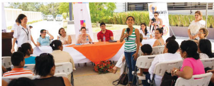
EL IMAS ha invertido $437 millones en ayuda integral.