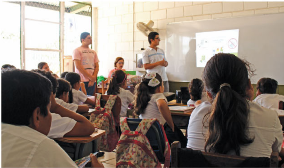
Es la primera vez que se da un avance significativo de recursos para los estudiantes guanacastecos.

► Los cantones más beneficiados son: Nicoya, Santa Cruz y Liberia