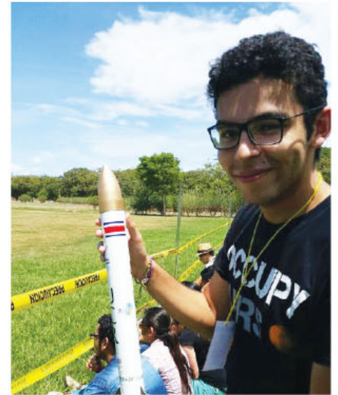
En el campamento aeroespacial los estudiantes tuvieron la oportunidad de construir e instrumentalizar cohetes.

Con el objetivo de desarrollar un evento interactivo y diferente en la educación de los ticos, un grupo de 51 estudiantes de ingeniería del país, tuvieron el reto de unir sus esfuerzos y creatividad, en el I Campeonato Aeroespacial, realizado del pasado 20 al 22 de julio, en la Universidad de Costa Rica de Liberia.