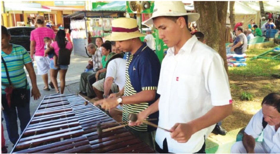
La tradición de la marimba es de evidente trascendencia para la cultura costarricense.

► Se relanza reconocimiento de tradición como Patrimonio Cultural del país