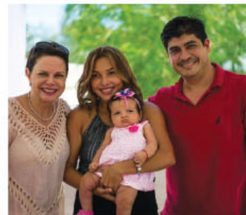
Se proyecta que para final de año en Guanacaste sean más de 3200 familias beneficiadas.