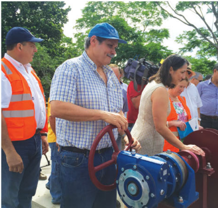
Autoridades del Gobierno en gira por Guanacaste.