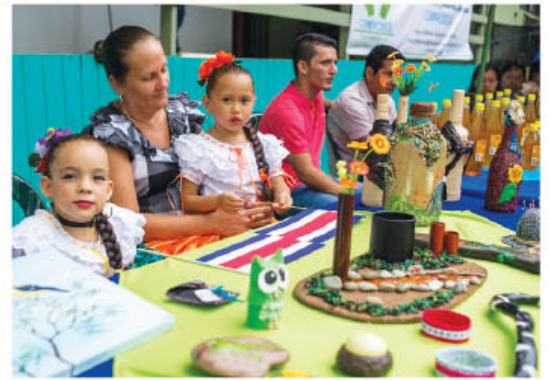
El mercado estará a cargo de familias y asociaciones artesanales.

El presidente de la República, Luis Guillermo Solís Rivera, y la primera dama, Mercedes Peñas Domingo, participaron en la colocación de la primera piedra de esta obra que se ubicará a 200 metros del parque en el cual se construirá un edificio de concreto, con acceso de dos rampas para cumplir con la Ley 7600 y que tendrá 13 espacios en un área total de 1.382 m 2 con una inversión de €264 millones. Este proyecto es gestionado por la Asociación Centro de Promoción y Desarrollo