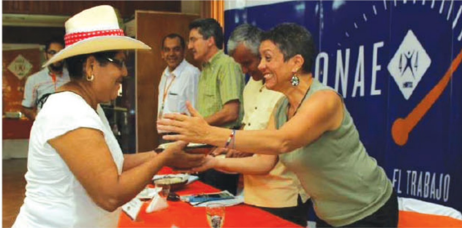
Cualquier organización comunal formalmente establecida puede aplicar para recibir el apoyo económico PRONAE 4x4.

► 1,500 personas son las personas atendidas en la provincia