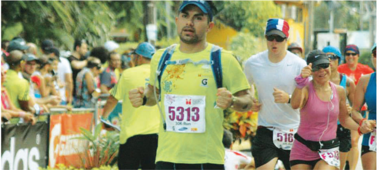
Más de 4000 atletas participarán en este encuentro deportivo.

Melissa Solís Cordero Periodista Periódico Mensaje