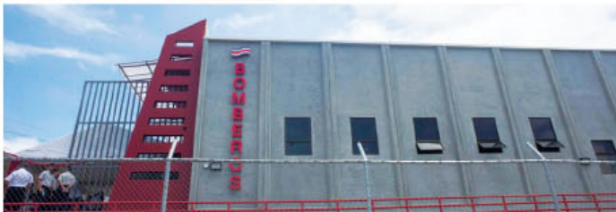
La nueva estructura cuenta con mayores dimensiones que le permiten albergar más bomberos.

► Lote de 2.330 metros fue donado por Asociación de Desarrollo Integral