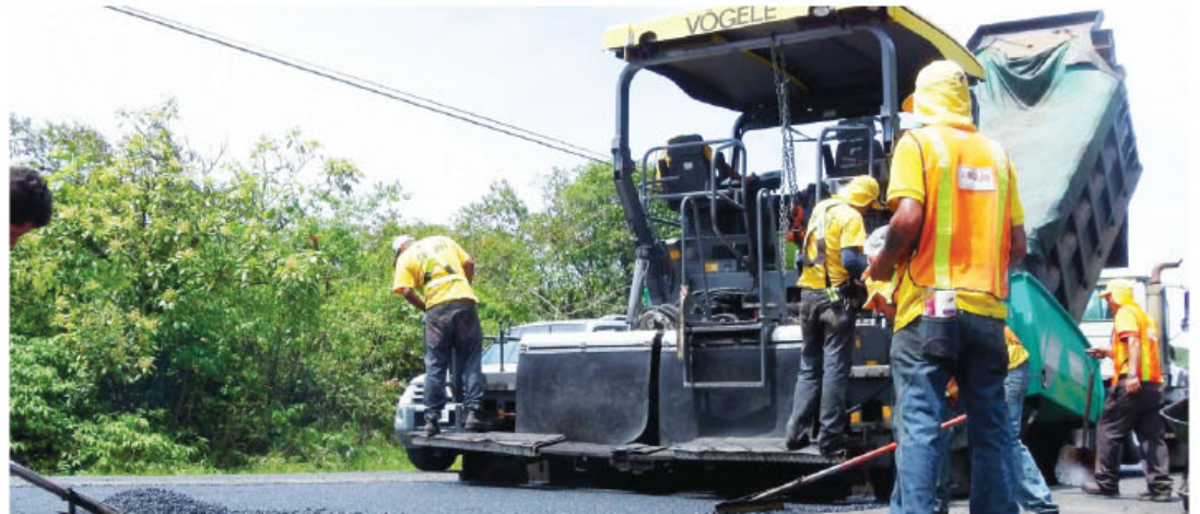
€16.024 millones es la inversión en carreteras en asfalto en la provincia de Guanacaste por el MOPT y CONAVI.

Se dispone de €1.032 millones para los 322 km de la red en asfalto, para lo que resta del año, considerando la temporada lluviosa que está consolidándose en la provincia de Guanacaste.