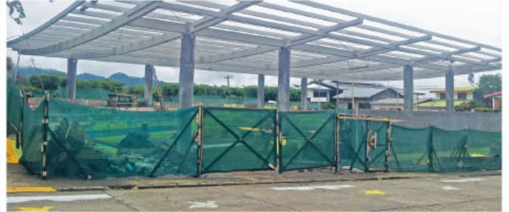
Así lucen los avances del anfiteatro

► El acto contará con actividades culturales y será abierto para toda la comunidad