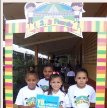
Niños de la Escuela Monte Negro de Bagaces unidos en la campaña 1,2,3 Puente.

► “1,2,3” tres simples pasos para llegar seguro a casa