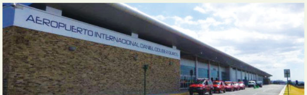
Vista externa del Aeropuerto Internacional Daniel Oduber Quirós.

Los resultados del trabajo de CORIPORT, concesionario de la terminal, han sido evidentes. Durante 2014 se logró reducir en casi el 19% el consumo de litros de agua por pasajero con respecto al 2013. Este ahorro en consumo de agua es equivalente a 46.850 bidones de 20 litros.