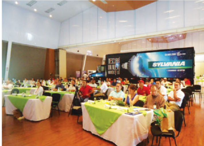
Participantes del seminario atentos en las exposiciones.