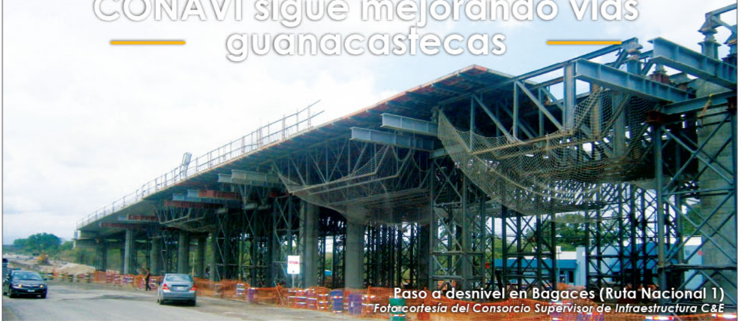
Paso a desnivel en Bagaces (Ruta Nacional 1)