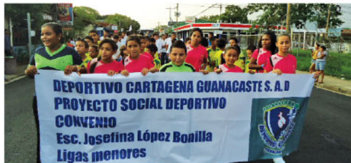
Vecinos celebrando y dándole la bienvenida al equipo.