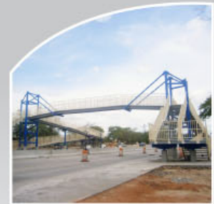
Puente peatonal Cañas – Liberia (Ruta Nacional 1)