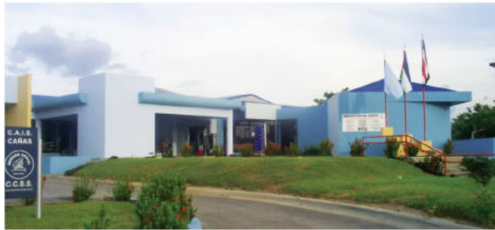
Vista del edificio del CAIS en Cañas.