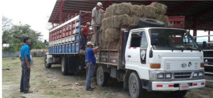
Entrega de insumos el pasado 5 de junio en la Región Chorotega.

"En julio del año pasado tuvimos una situación difícil, el Ministro tuvo que presentar una modificación en el presupuesto ordinario del MAG ante la Contraloría, para que autorizara las compras directas y poder agilizar el proceso, pero esto también se llevó su tiempo", indicó Vásquez.