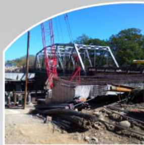
Puente Corobicí Cañas – Liberia (Ruta Nacional 1)