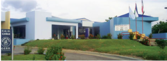
Vista del edificio del CAIS en Cañas.

► Para alcanzar el objetivo también se requiere la contratación de un mayor número de especialistas