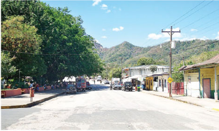
Panorámica del cantón de Nandayure, alrededor del parque.