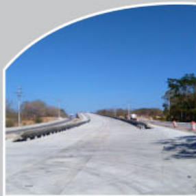
Intersección Upala Cañas – Liberia (Ruta Nacional 1)