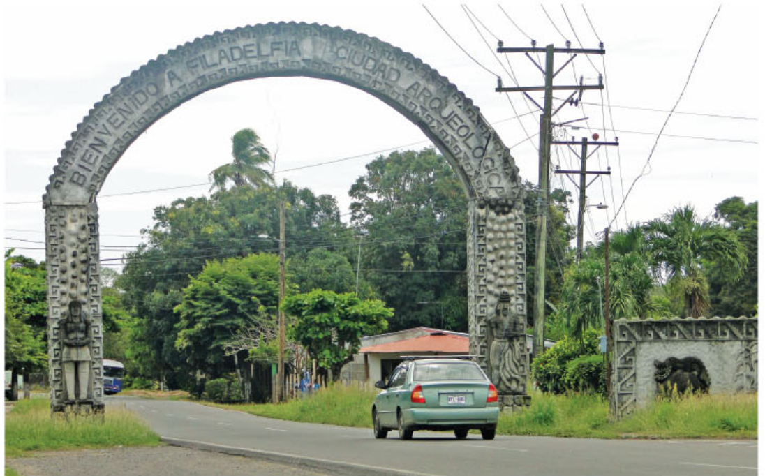
En una de las entradas del cantón se observa como se identifica como ciudad arqueológica.

En la actualidad, Carrillo carece de espacios para recuperar y exponer las piezas halladas en esa época, por lo que la mayoría fueron reubicadas a diferentes museos del casco central.