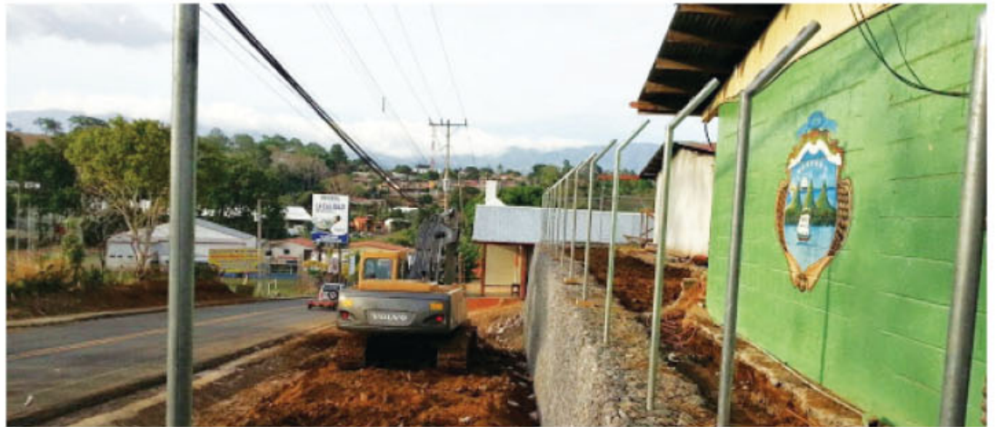
Avances de una de las construcciones de las escuelas de Guanacaste.

La DICE registra que, antes de mayo de 2014, la administración anterior apenas cumplió con la entrega de 5 de los 74 centros educativos con problemas de infraestructura considerados por el personal técnico en "situación grave".