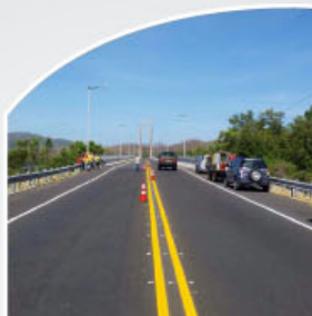
Demarcación en la Ruta 18

Conavi invierte más de $190 millones en estas y otras vías nacionales ubicadas en la bella provincia de Guanacaste