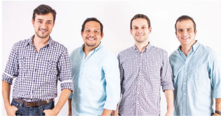
Grupo de la Media Docena se presentará próximamente en Guanacaste.

► Centro de Convenciones de Coopeguanacaste será el escenario ideal para la risa en próximo 27 de marzo