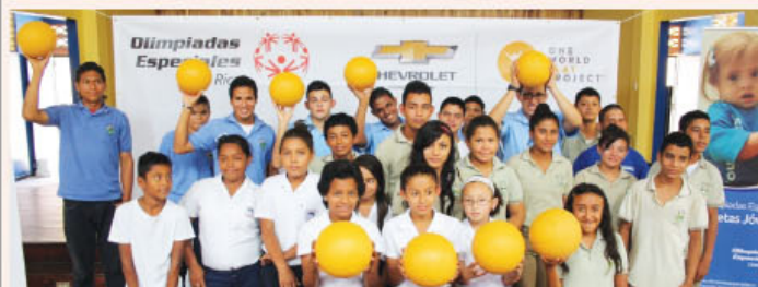
En el Gimnasio del Comité Cantonal de Deportes de Liberia se realizó el acto oficial el pasado 11 de marzo.

► El mapeo de los centros educativos lo efectuó Olimpiadas Especiales Costa Rica