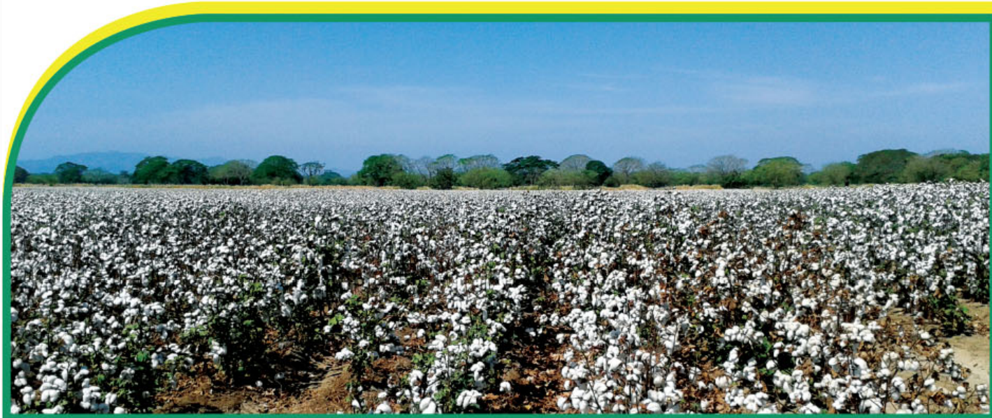
La nueva producción de algodón de la compañía D&PL sobrepasa este año, los 145 mil kilos de semillas de calidad.

► La compañía cuenta con altos estándares de calidad y bioseguridad