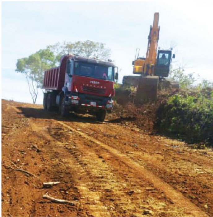
Trayecto que comunica a Nosara con las comunidades de Las Flores, Río Montaña y Virginia será de dos carriles.

► El trayecto en esta nueva ruta reduce la distancia en unos 20 kilómetros