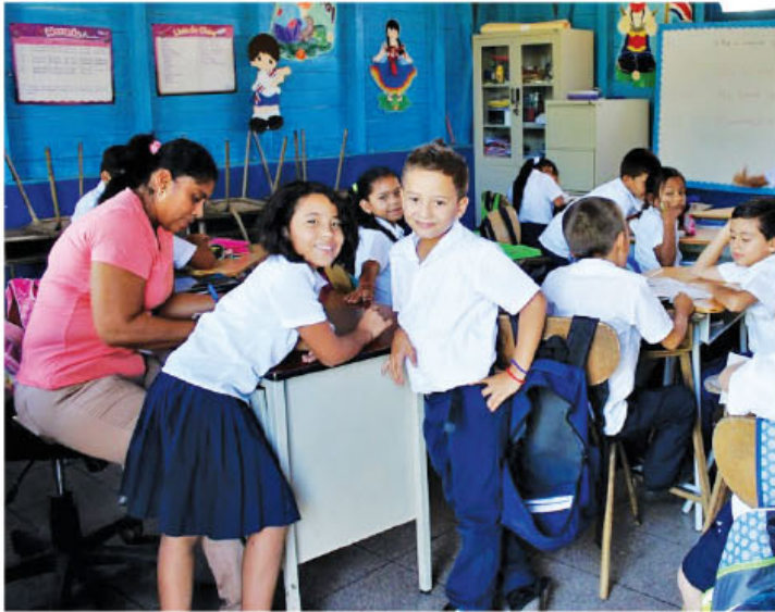
Niños y niñas de escuela Ignacio Gutiérrez. San Blas Sardinal

► Administración se propone iniciar obras durante todo el 2015