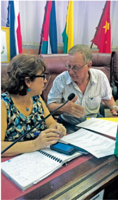
Durante la firma del acuerdo el Alcalde de Cañas y la Presidenta Ejecutiva del AyA aprovecharon para conversar.