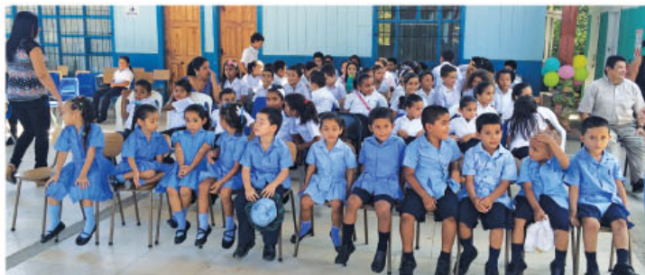
Niños celebrando y disfrutando del nuevo comedor escolar.