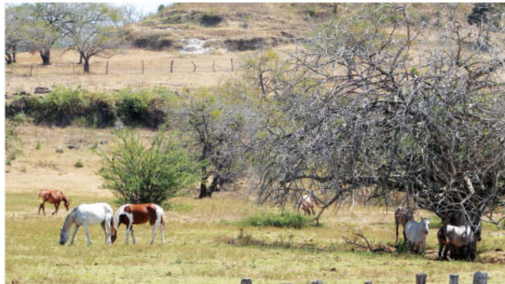
Los daños reportados en la producción ganadera por el déficit de agua requirió declarar emergencia sanitaria en la provincia.

El Servicio Nacional de Salud Animal, SENASA, entidad adscrita al MAG, será la entidad encargada de ejecutar los $600 millones provenientes del fondo acumulativo de emergencias sanitarias, los cuales serán destinados a atender los daños registrados en la producción ganadera, pesquera y apícola en los cantones de Liberia, Tilarán, Nicoya, Santa