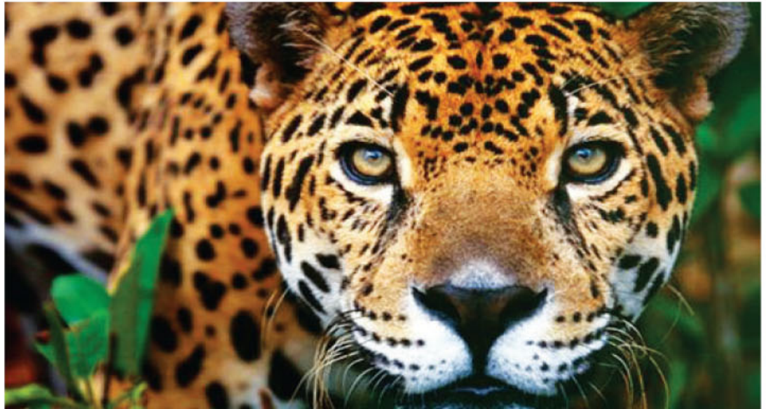
El Jaguar es clave para la salud de los bosques.

Imponente, robusto y musculoso, su presencia es clave para la salud de los bosques, y por eso, conocer más acerca de su biología ya que es fundamental para el desarrollo de planes de manejo y toma de decisiones en el manejo de los recursos naturales. Desde el 2010, el Programa Jaguar del Instituto en Conservación y Manejo de Vida Silvestre de la Universidad Nacional (Icomvis-UNA) en conjunto con el Área de Conservación Guanacaste (ACG) realiza un monitoreo de los jaguares y sus presas, con el fin de definir estrategias para su conservación.