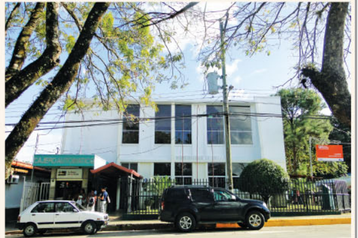
Edificio de la Municipalidad de Nicoya.

Se espera que este proyecto de infraestructura vial termine a finales de marzo de este año y han sido una labor compartida entre la Asociación de Desarrollo Integral de Nosara (ADIN), Ministerio de Obras Públicas y Transporte (MOPT) y la Municipalidad de Nicoya.