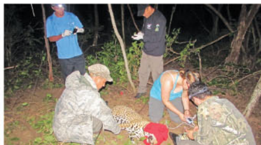
El Programa Jaguar del Instituto en Conservación y Manejo de Vida Silvestre de la Universidad Nacional (Icomvis-UNA) en conjunto con el Área de Conservación Guanacaste (ACG) realiza un monitoreo de los jaguares y sus presas, con el fin de definir estrategias para su conservación.