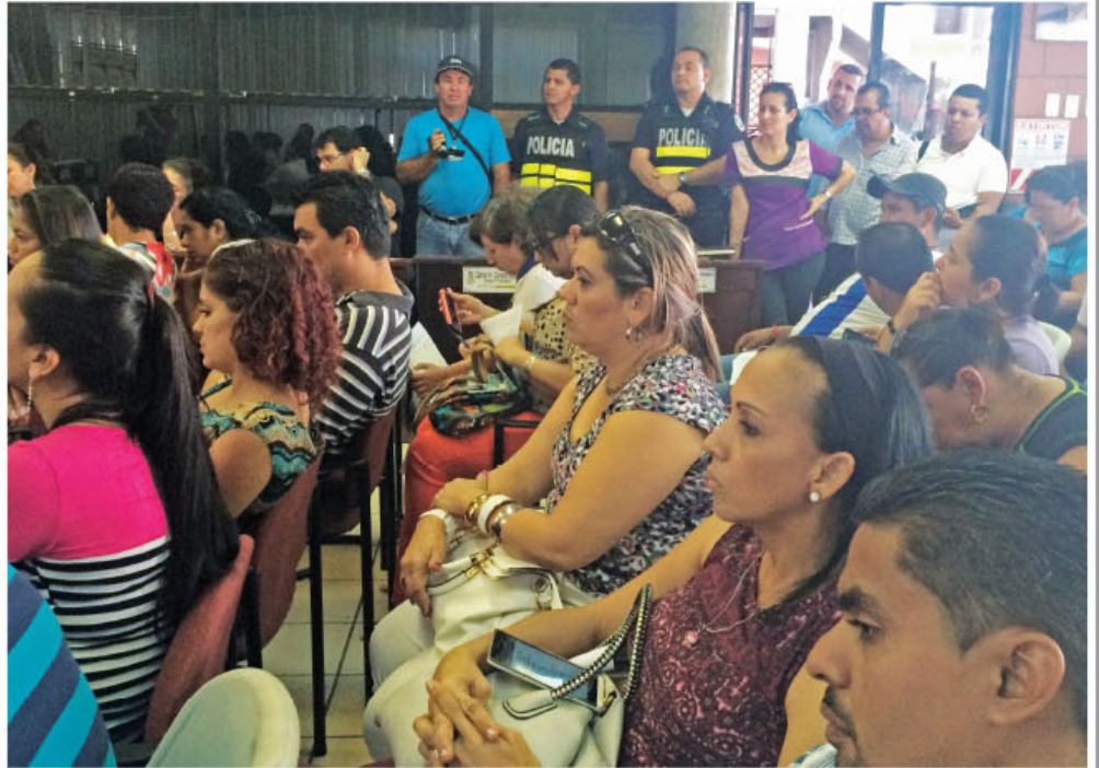
Vecinos de la comunidad de Cañas asistieron a escuchar los temas que se acordaron en la reunión.