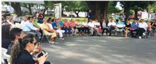
Público presente en el acto inaugural del mural.