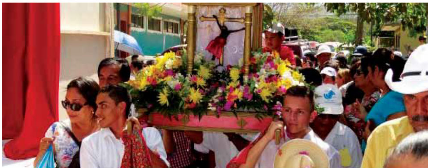
El 17 de enero, se llevará a cabo la procesión en honor al Santo Cristo de Esquipulas, a las 4 pm.