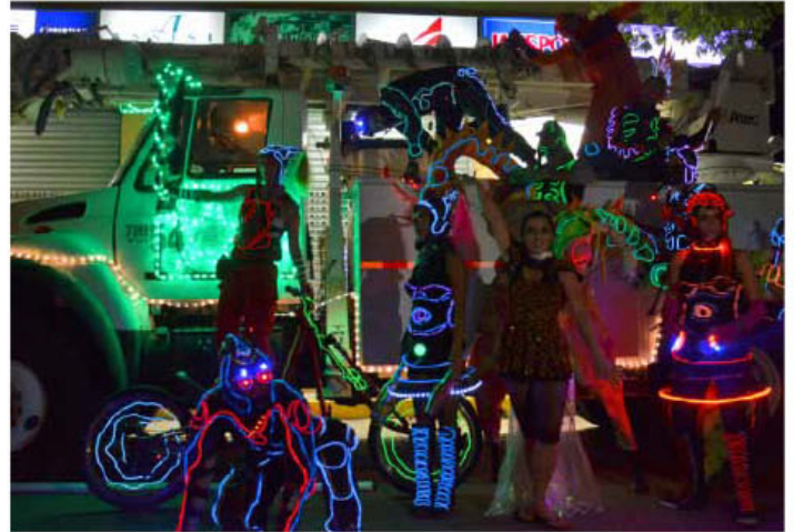
Carrozas formaron parte del espectáculo

► Zancos, acróbatas y un show aéreo en tela fueron parte de presentación