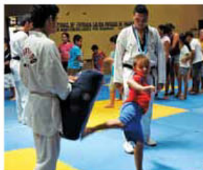
El evento rescata los juegos tradicionales del cantón para el disfrute de la familia.

Al mediodía se brindará un espacio para que las familias realicen su almuerzo al estilo picnic, disfrutando de la naturaleza de la zona.