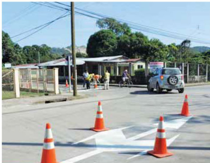
La demarcación y cambios de vía en Nicoya.

Para salir de la ciudad de Nicoya los carros ingresarán por la ruta que