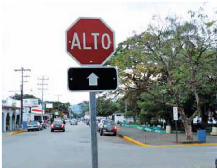
Los rótulos de señalización forman parte de los cambios en gestión vial.

► Iniciativa tuvo el financiamiento de ¢ 41,8 millones aportados por la Unidad de Gestión Vial de la Municipalidad