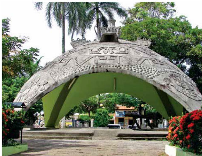
Parque Bernabela Ramos en Santa Cruz.

“A nivel de espectáculo incorporamos más marimbas en las principales ca-