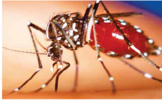
Los cantones que presentan mayor incidencia de casos son: Santa Cruz (315), Nicoya (155) y Carrillo (90).

Hasta la Semana Epidemiológica 49 (del 16 al 22 de noviembre) se han captado 40 casos de fiebre Chikungunya importados y 7 autóctonos, los cuales se distribuyen de la siguiente manera: Parrita (1), Costa de Pájaros (1), Manzanillo (3), Chomes (1), Tamarindo (1).