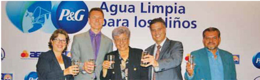
Programa Agua Limpia para los Niños.