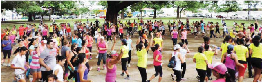
Los seguidores de la zumba, podrán participar del "Navi Zum" que se hará en el Parque Central, a partir de las 7 pm.