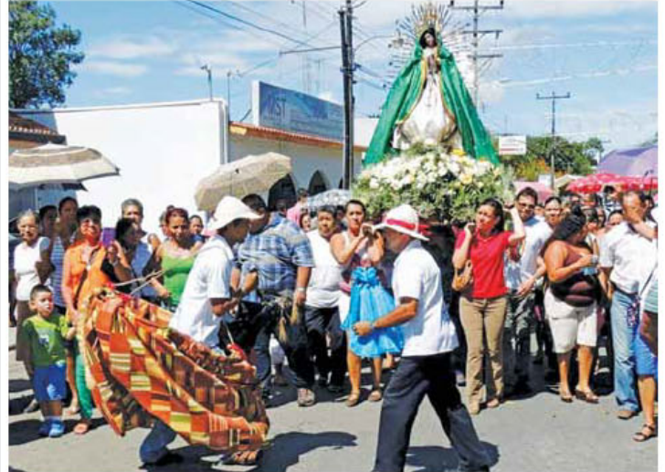
El baile de la Yegüita con el tambor y la chirimía, por las calles de Nicoya en la procesión de la Virgen de Guadalupe, cerca de "la Cofradía"