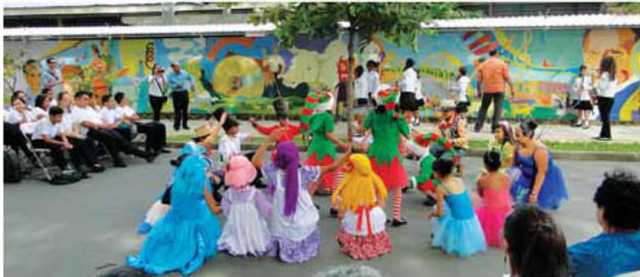
Niños de la Escuela Aplicación amenizaron parte de la actividad.