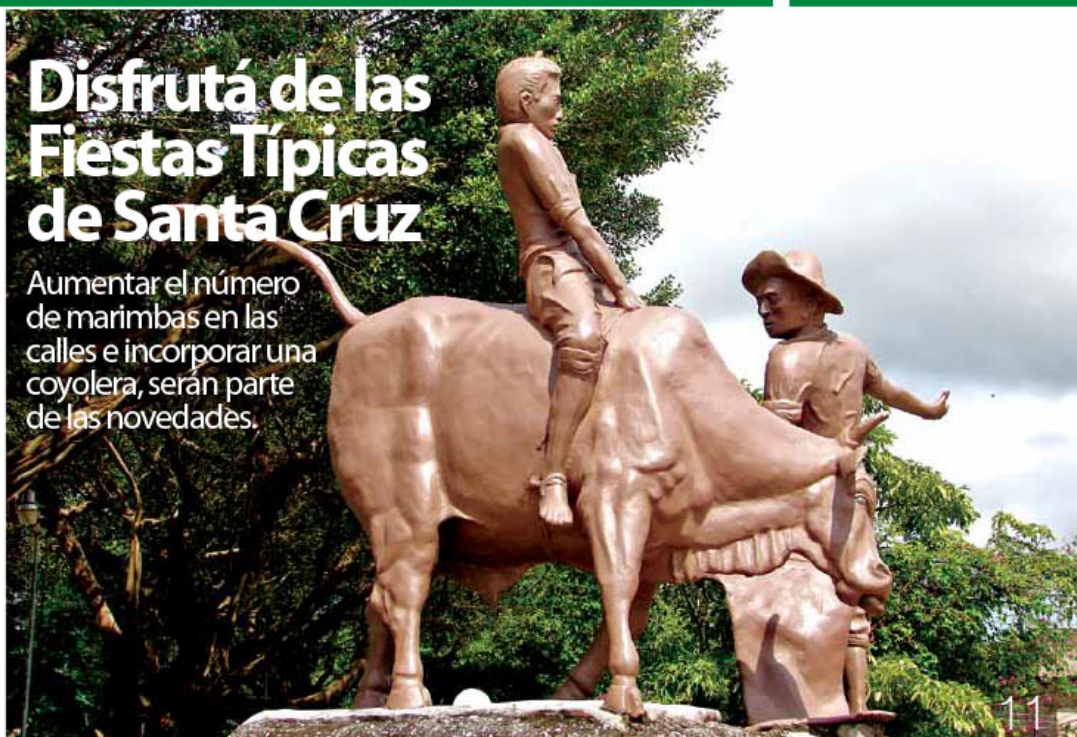
Monumento al Sabanero.

Aumentar el número de marimbas en las calles e incorporar una coyolera, serán parte de las novedades.