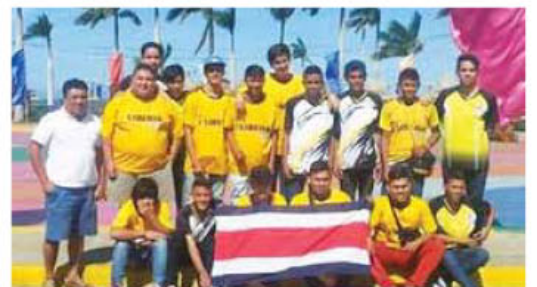
16 jóvenes de Liberia entre 14 a 17 años participaron en torneo internacional de balonmano.

► El encuentro contó con equipos de alto rendimiento de Honduras, Guatemala, Panamá, Nicaragua y México