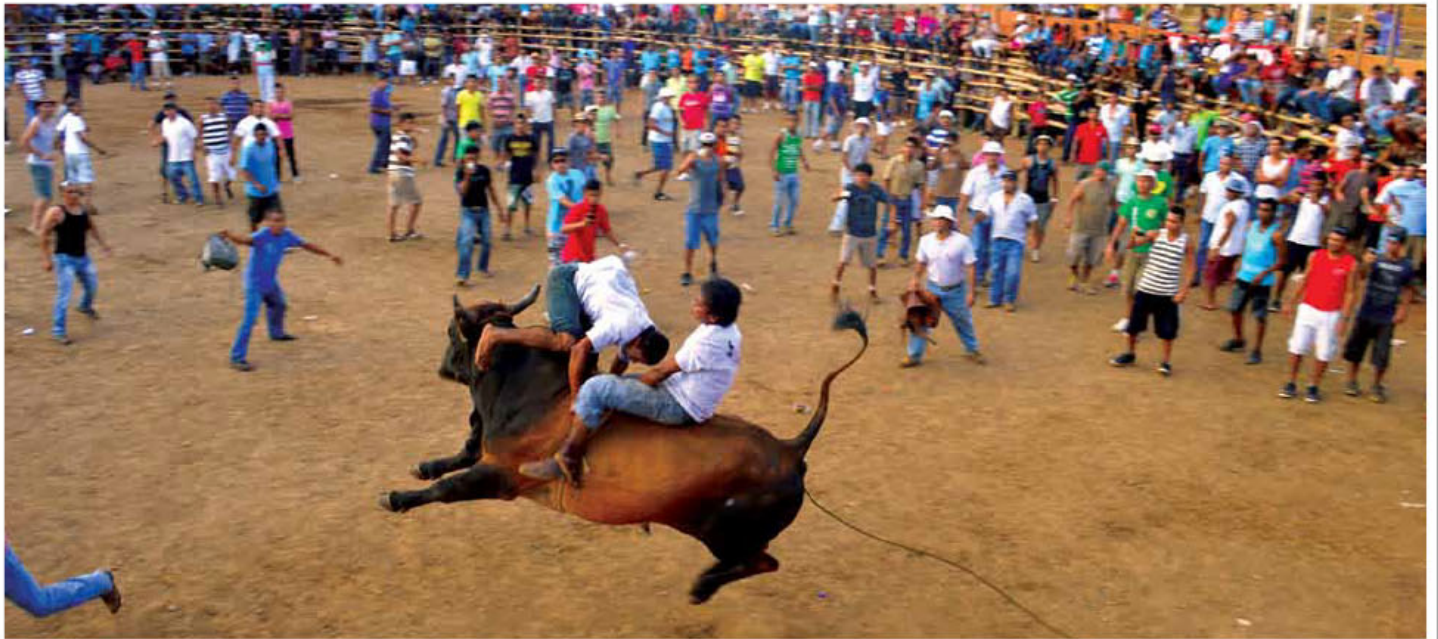
Las montaderas se realizarán todos los días a las 2 pm y 8 pm.