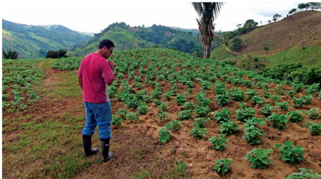
Plantación de frijol.

En la región Chorotega las organizaciones que podrán beneficiarse son: Asolcruz, Coope Belice y la Asociación de Productores de Orosi, que integran 90 productores.