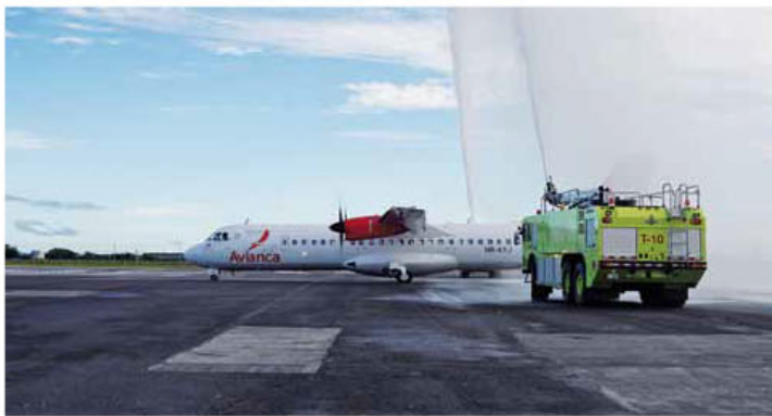
Llegada del avión de Avianca al Aeropuerto Daniel Oduber.

► Avianca renueva su flotilla para viajes a Costa Rica