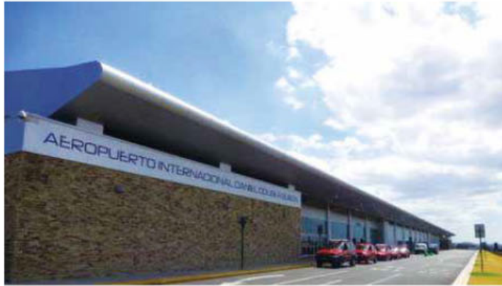
Se estima que la nueva ruta hacia el Aeropuerto Daniel Oduber será de seis kilómetros.