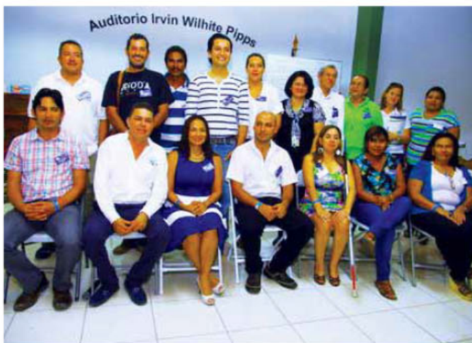
El Comité Directivo electo democráticamente con representación de la sociedad civil, instituciones públicas presentes en el territorio, empresa privada y gobiernos locales.

L A CRUZ. Una vez más el Inder logró que de manera democrática los actores comunales, en este caso de los cantones guanacastecos de Liberia y La Cruz, eligieran a sus representantes en un Comité Directivo que tiene la particularidad de incluir a la población migrante y a los pescadores. Así quedó establecido el pasado miércoles 12 de noviembre, el primer territorio de la Región Chorotega y el octavo en el país.